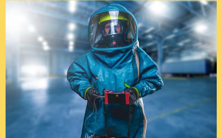
Seguridad y Salud en el Trabajo: Emergencias

Listado de cursos básicos, así como orientados a la supervisión y dirección en materia de Seguridad y Salud en el Trabajo.