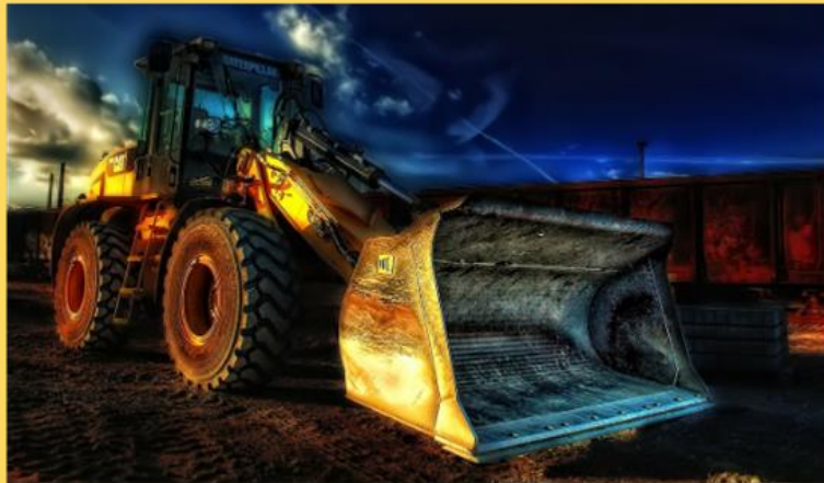
Seguridad y Salud en el Trabajo

Listado de cursos básicos, así como orientados a la supervisión y dirección en materia de Seguridad y Salud en el Trabajo.